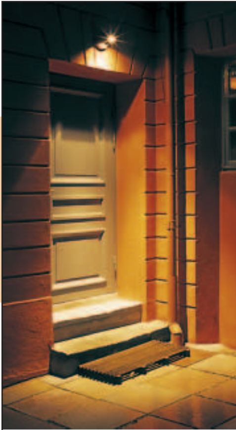
Lampen over inngangsdøren ønsker deg velkommen og lyser godt der du skal sette føttene.